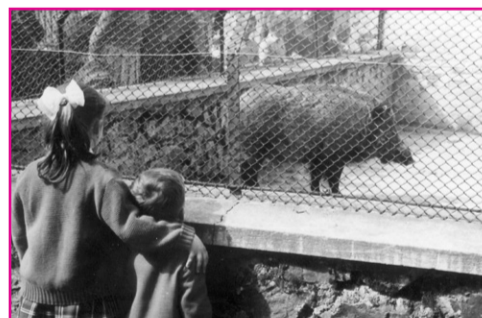
Expozice prase divoké